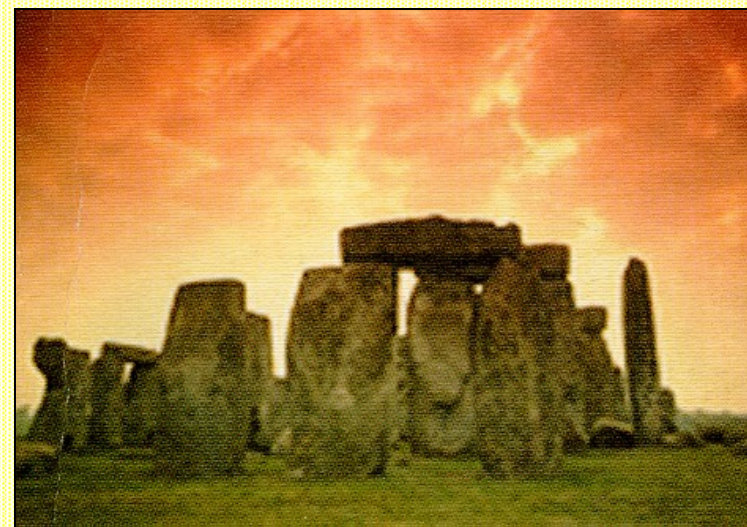
Editrice RODANA - Perugia

Presentazione del libro Cagliari 8 Marzo 1997 Ist. Magistrale Eleonora D'Arborea